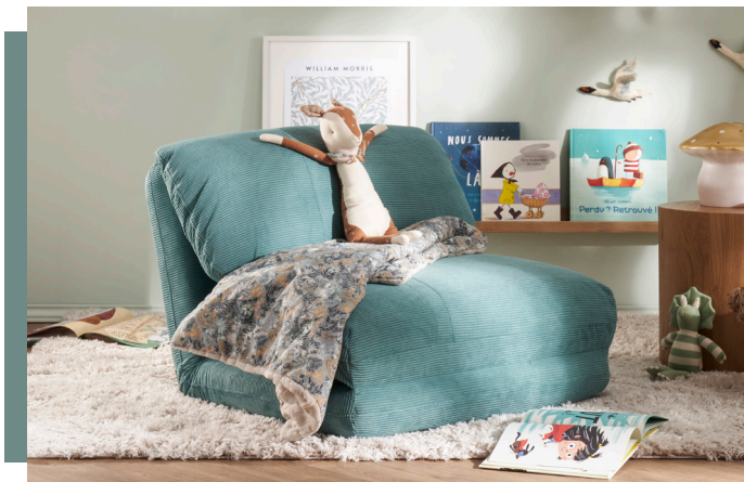
SALLY - 449.99 €