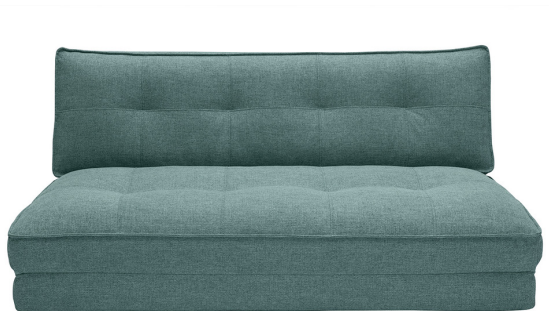
SPENCER - 399.99 €