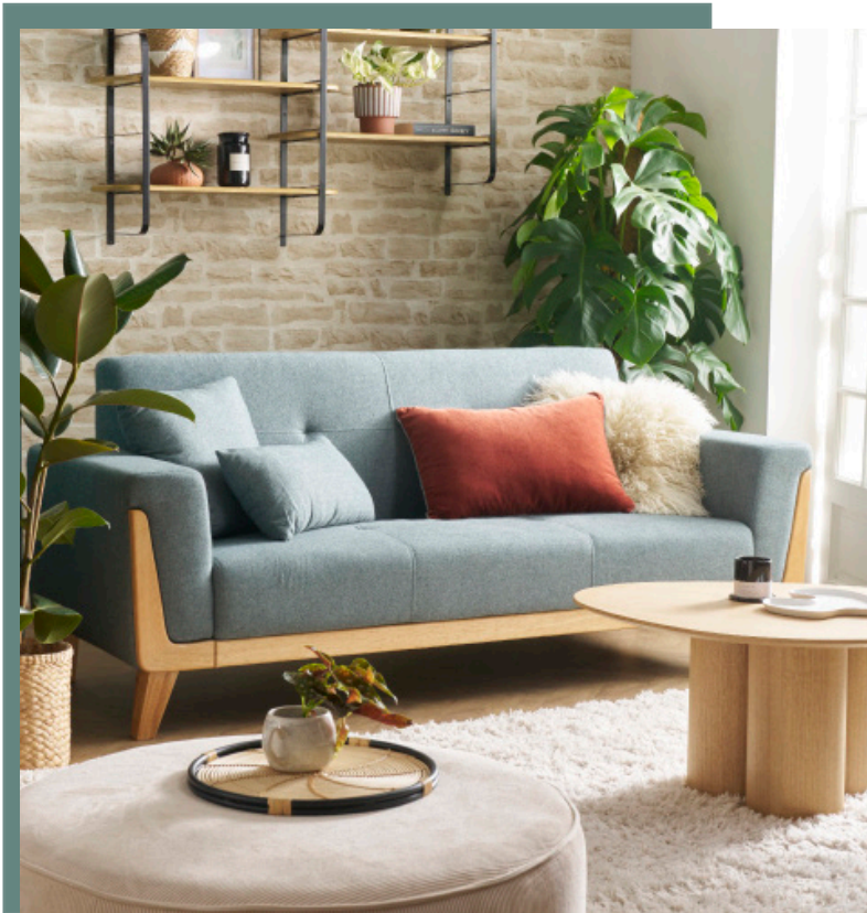
FJORD - 629.99 €