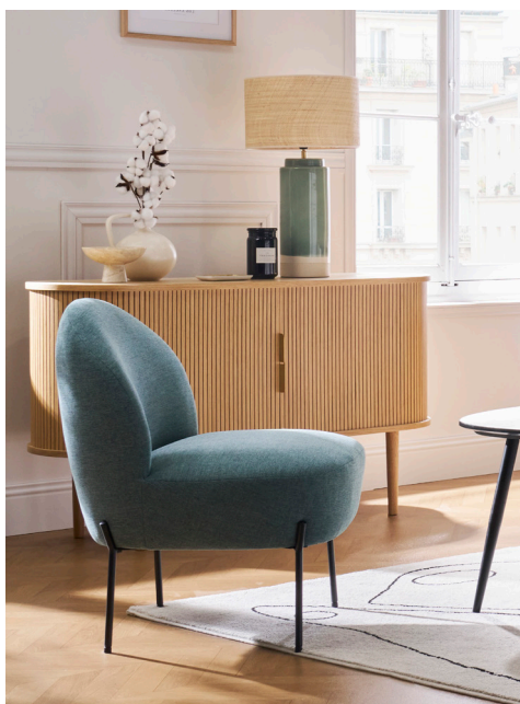
BELEY - 199.99 €