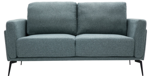
ISKO - 369.99 €